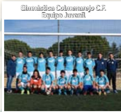
Gimnástica Colmenarejo C.F. Equipo Juvenil