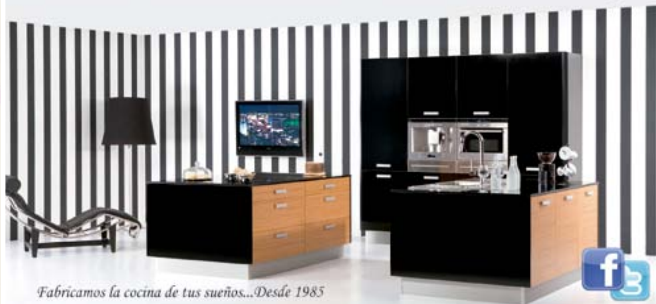
Fabricamos la cocina de tus sueños...Desde 1985

Cocinas - Electrodomésticos - Baños - Reforma Integral