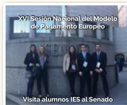
XVI Sesión Nacional del Modelo de Parlamento Europeo