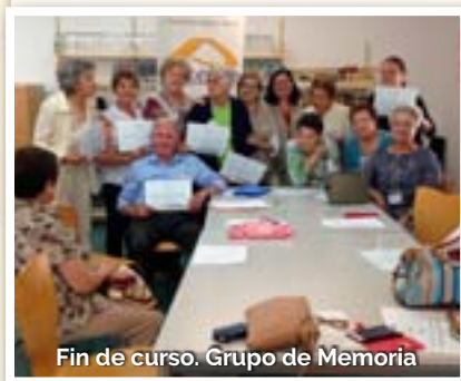
Fin de curso. Grupo de Memoria