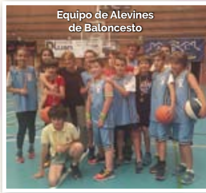
Equipo de Alevines de Baloncesto