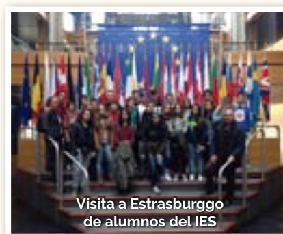
Visita a Estrasburgo de alumnos del IES