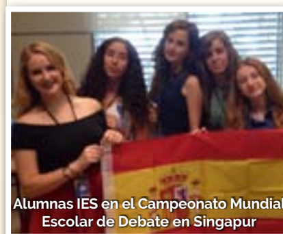
Alumnas IES en el Campeonato Mundial Escolar de Debate en Singapur