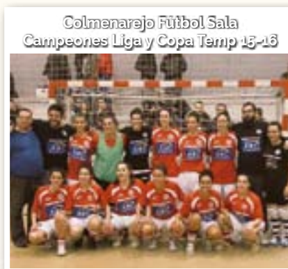
Colmenarejo Fútbol Sala Campeones Liga y Copa Temp 15-16