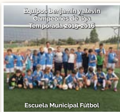
Equipos benjamín y alevín Campeones de liga Temporada 2015-2016