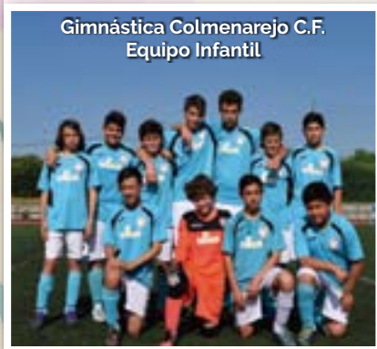
Gimnástica Colmenarejo C.F. Equipo Infantil