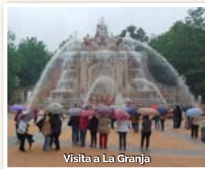
Visita a La Granja