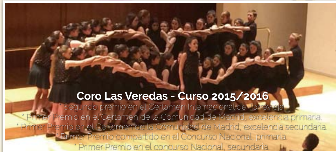
Coro Las Veredas - Curso 2015/2016