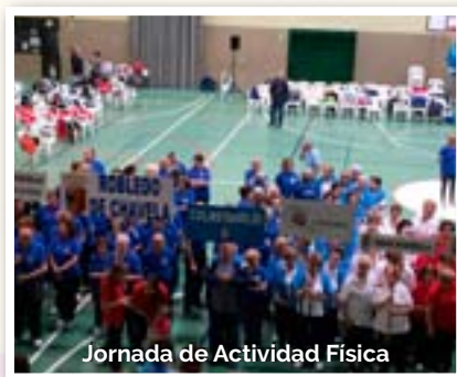
Jornada de Actividad Física