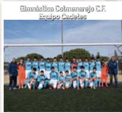
Gimnástica Colmenarejo C.F. Equipo Cadetes