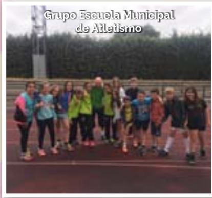
Grupo Escuela Municipal de Atletismo