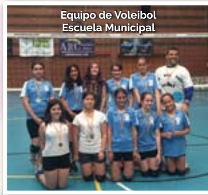
Equipo de Voleibol Escuela Municipal