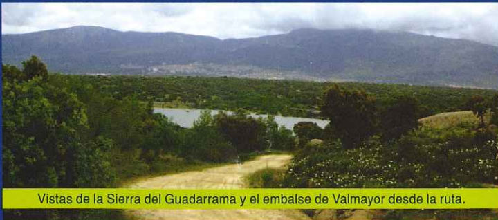
Vistas de la Sierra del Guadarrama y el embalse de Valmayor desde la ruta.

Una vez unidos los dos ramales de inicio de ruta, seguiremos rumbo sur por la Cañada Real Segoviana durante tres kilómetros atravesando encinares ( Quercus ilex ) y fresnedas ( Fraxinus angustifolia ). Durante este tramo también atravesaremos el punto más alto del recorrido 910 metros, desde el cual podremos disfrutar de unas magníficas vistas de la Sierra de Guadarrama (al norte) y del embalse de Valmayor (al sur).