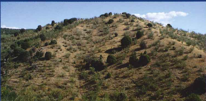
Paisaje que atraviesa la senda a su paso por el Camino del Pardillo a Colmenarejo.

Una vez visitado Colmenarejo seguiremos nuestra ruta hacia el sur con dirección Villanueva del Pardillo saliendo por la calle Camino de las Cañadillas, a partir de ahí la ruta cambia varias veces de camino por lo que deberemos estar atentos para seguir la senda correcto. Atravesaremos primero dehesas de encinas ( Quercus ilex ), tan características de Colmenarejo, que darán paso a enebrales de Juniperus oxycedrus en el momento en que la ruta comienza su descenso hacia el arroyo de los Palacios por la Colada del camino del Pardillo.