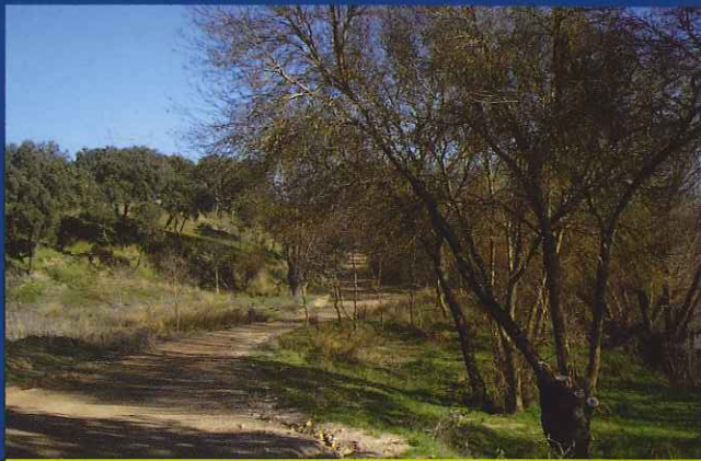
La senda discurre coincidiendo en gran parte con el Camino de la Zarzuela.

Siguiendo por este camino sin desviarnos durante siete kilómetros llegaremos al puente de hierro del ferrocarril sobre el Guadarrama que quedará a nuestra izquierda. Nosotros seguiremos por el camino que traíamos llamado Camino de la Zarzuela, hasta el paso inferior de la carretera A-5, en las inmediaciones de la Dehesa de Marimartín donde podremos disfrutar de un bien conservado pinar de pino piñonero ( Pinus pinea ).