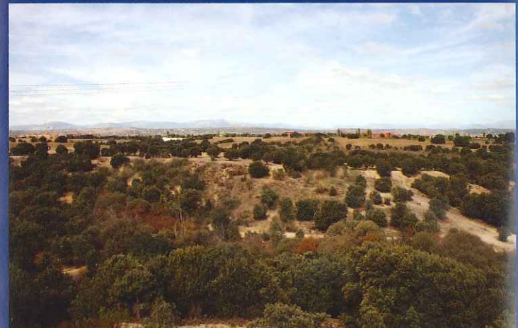
Vistas del Barranco del arroyo del Molino, próximo a Villanueva de la Cañada.

Una vez en la entrada de Villanueva de la Cañada, la bordaremos dejándola a nuestra derecha, hasta tomar un camino por el cual después de atravesar el arroyo del Molino y pasear entre encinares ( Quercus ilex ) y campos de cultivo llegaremos a Brunete por la entrada a la localidad de la M-513.