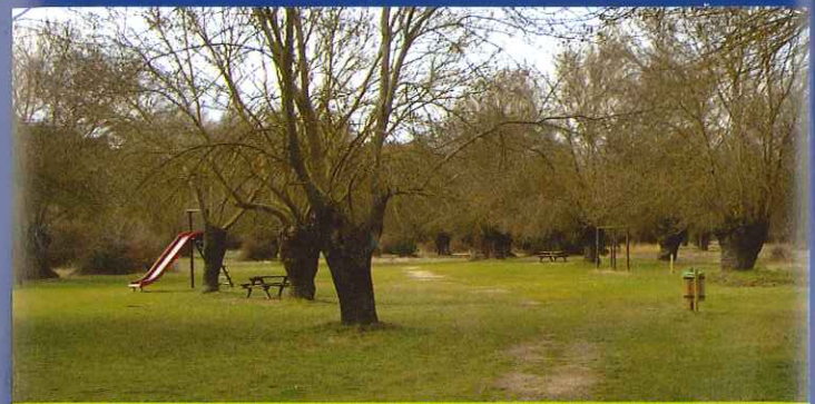
Fresneda en el área recreativa La Ermita de Villanueva del Pardillo.

Nosotros cruzaremos el arroyo y tomaremos el camino que sale a la izquierda del mismo y que nos conducirá a Villafranca del Castillo.