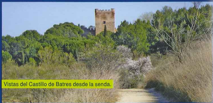
Vistas del Castillo de Batres desde la senda.

Una vez en la carretera M-404, utilizaremos su arcén para atravesar el río Guadarrama, extremando siempre las precauciones. Ya en la otra orilla del río nos desviaremos por un camino que saldrá a nuestra izquierda por el que cruzaremos por un paso inferior la carretera y que nos conducirá a un agradable pinar de pino piñonero ( Pinus pinea ). Saldremos de este pinar por el camino que toma dirección sureste y atraviesa el arroyo Valdecarros. Una vez atravesado el arroyo nuestro camino inicia una ascensión hacia Batres, atravesando campos de cultivo y densos retamares que en algunos tramos rodean por completo el estrecho camino. Según nos vamos acercando a la localidad de Batres, ésta nos dará la bienvenida con las impresionantes vistas de su castillo el cual se podrá observar desde gran parte de este tramo.